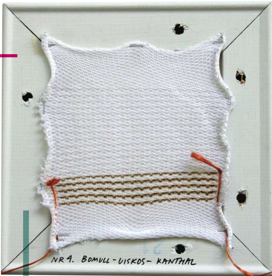
VANTAR MED INBYGGDA MOBILTELEFONER, VASKOR SOM ÄNDRAR FÄRG NÄR DET RINGER ELLER LINNEN SOM MÄTER HJÄRTRYTM